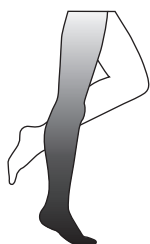
tensed muscles gespannte Muskulatur musculature contractée

Les bandes swisslastic® sont fabriquées en Suisse selon la norme ISO 9001 et portent le label CE, garant d'une qualité du plus haut niveau.