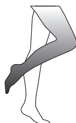
relaxed muscles entspannte Muskulatur musculature décontractée