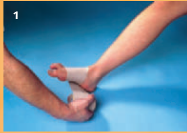
Example 1 Beispiel 1 Exemple 1