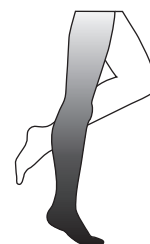
tensed muscles gespannte Muskulatur musculature contractée